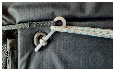
Second step of the problem, the third is the accidental opening