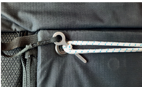
First step of the problem