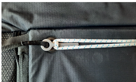
Splint in the right position

Tras una investigación, encontramos una posible configuración del sistema de cierre, en la que la tensión de los elásticos podría provocar que el pasador metálico del asa que mantiene cerrado el contenedor del paracaídas se saliera (ver secuencia fotográfica más abajo).